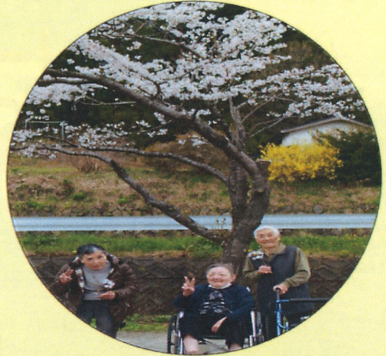
桜も笑顔も満開です