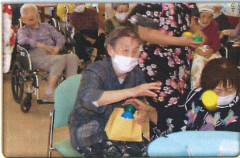
的あてゲームで鬼退